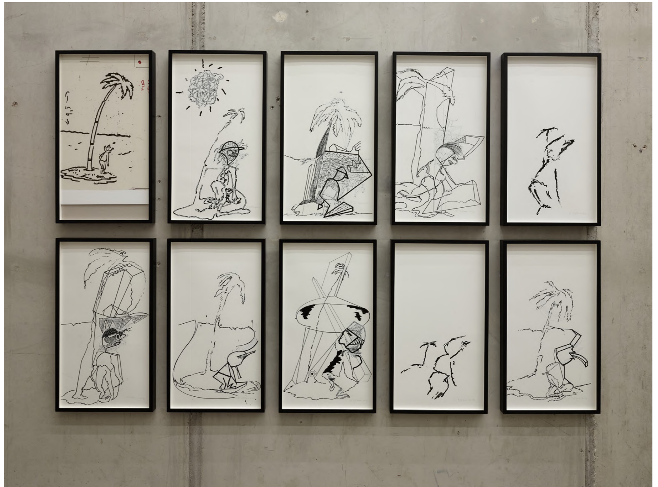
Crusoé, 2013 Found drawing from Rico Tipo magazine, Buenos Aires, 1958 and 9 variations, ink and liquid paper on paper 71 x 39 cm each