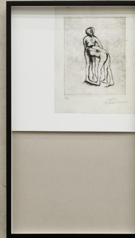
Tomás Espina, 2013 Found metal engraving from Tomás Espina, Ed. 6/50 and 3 variations, ink and liquid paper on paper 71 x 39 cm each

The same rhythm informs Dittborn's drawings. They are the return of something vague that looms on the edge of perception and now attains form. Until the next form overtakes the first. None of this is funny in and of itself. What is funny, however, is the way the motifs drift when the draftsman allows them the room they need to evolve as they will. And how a stroke of the pen and another stroke, tiptoeing around the question of visibility, can build up to an absurd struggle over perspectives and meanings. A struggle over deception, assertion, and ignorance, over faulty logic, and, yes, also over the spirit of anarchy.