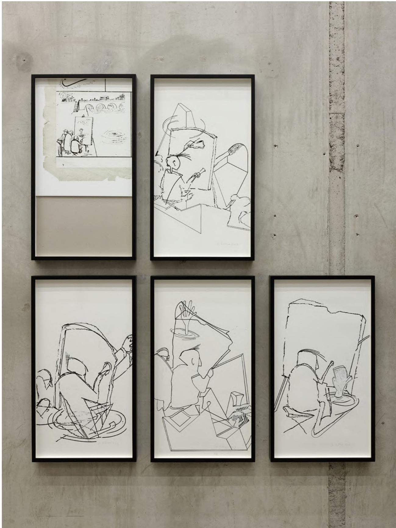
El Pintor, 2013 Found drawing from Zig Zag magazine, Santiago, 1955 and 4 variations, ink and liquid paper on paper 71 x 39 cm each