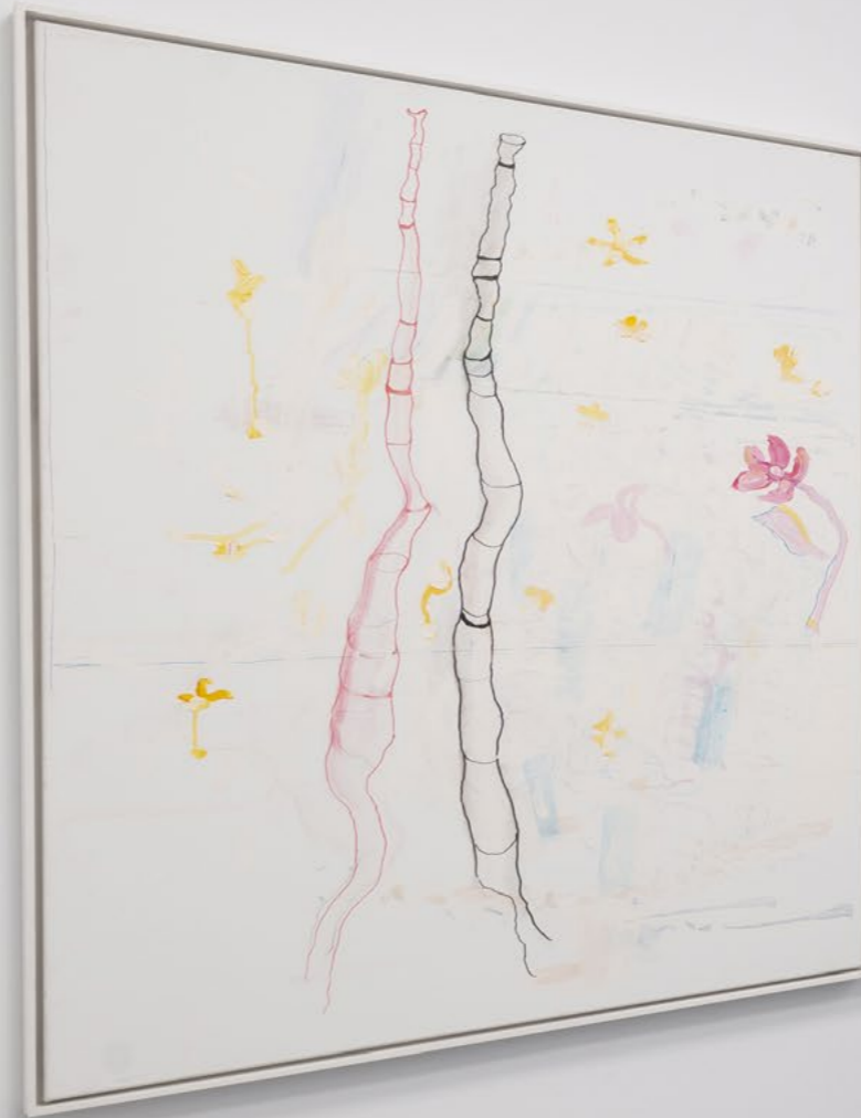
Wire Thread, 1979 mixed media 172.5 x 27 x 19 cm