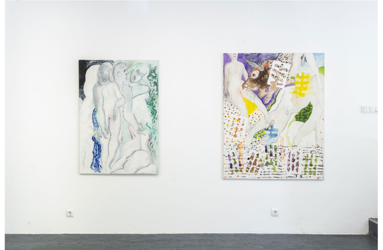
Frauen, 1996 dispersion, acrylic, pencil on canvas 125 x 94.5 cm