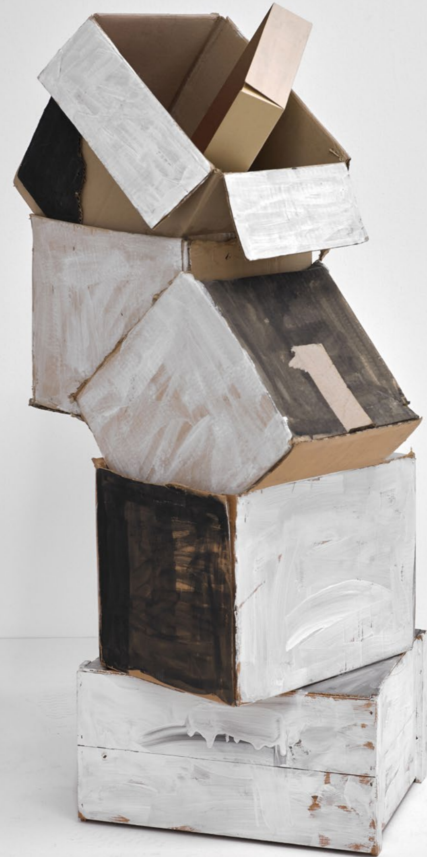
Stapel, 1990 wood, cardboard, dispersion, pencil 105 x 56.5 x 45 cm