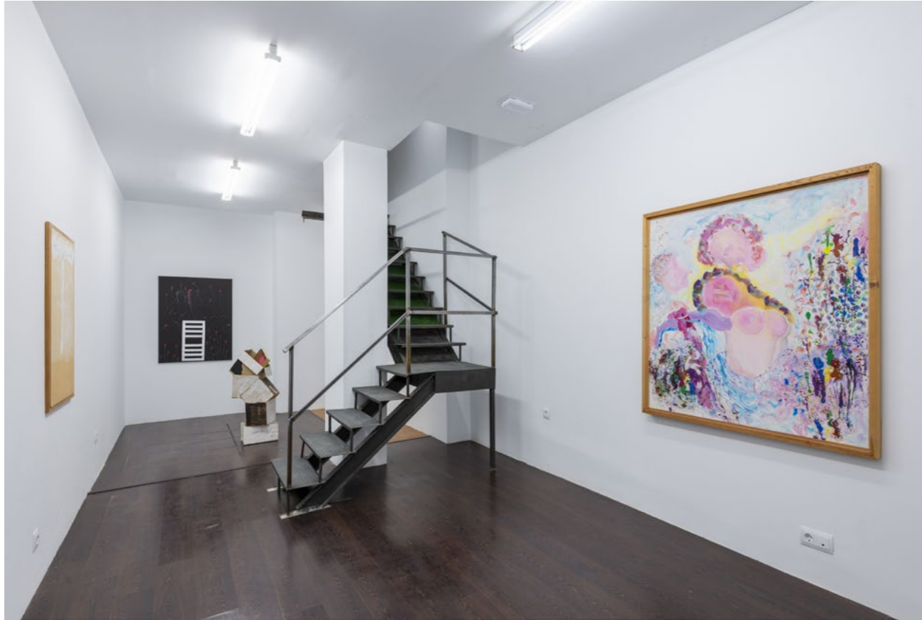
Oswald Oberhuber. Un futuro Exhibition view KOW Madrid, 2019