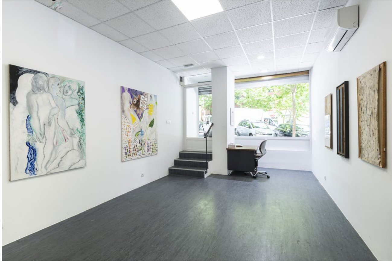
Oswald Oberhuber. Un futuro Exhibition views KOW Madrid, 2019