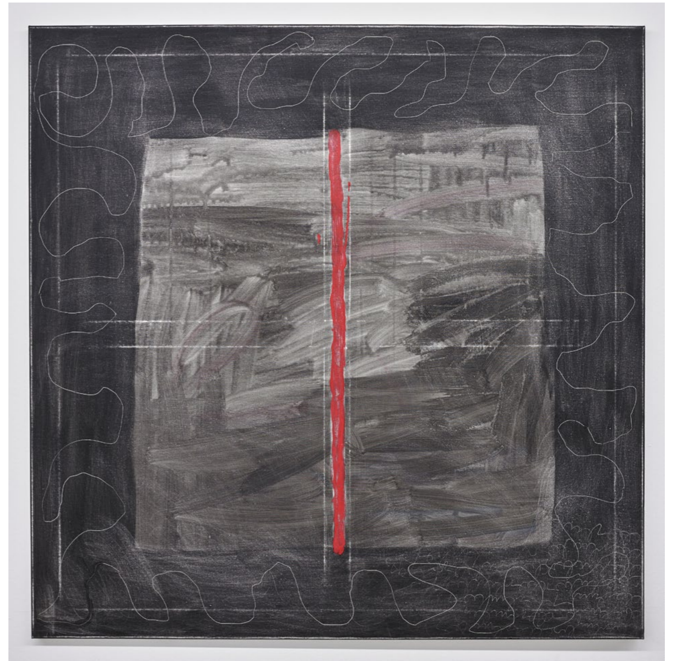
Untitled, 1988 acrylic on canvas 130 x 130 cm

Die zweite Ausstellung von Oberhuber bei KOW vereint Werke aus den sieben Jahrzehnten eines Lebens, das die verschiedensten Phasen der europäischen Nachkriegsentwicklung durchlaufen hat. Wie das Werk von Oswald Oberhuber lebt Europa von seiner Pluralität und einem ausreichenden Maß an konzeptueller Anarchie und permanenter Veränderung. Die Phrasen jener, die die Gedanken, Träume und Taten anderer einzuschränken hoffen, brauchen heute offenes Paroli und auch die Stimmen derer, die eine gelebte Erinnerung wachhalten können, bevor ihre Vergangenheit nur noch als Anekdote in einem Text existiert.