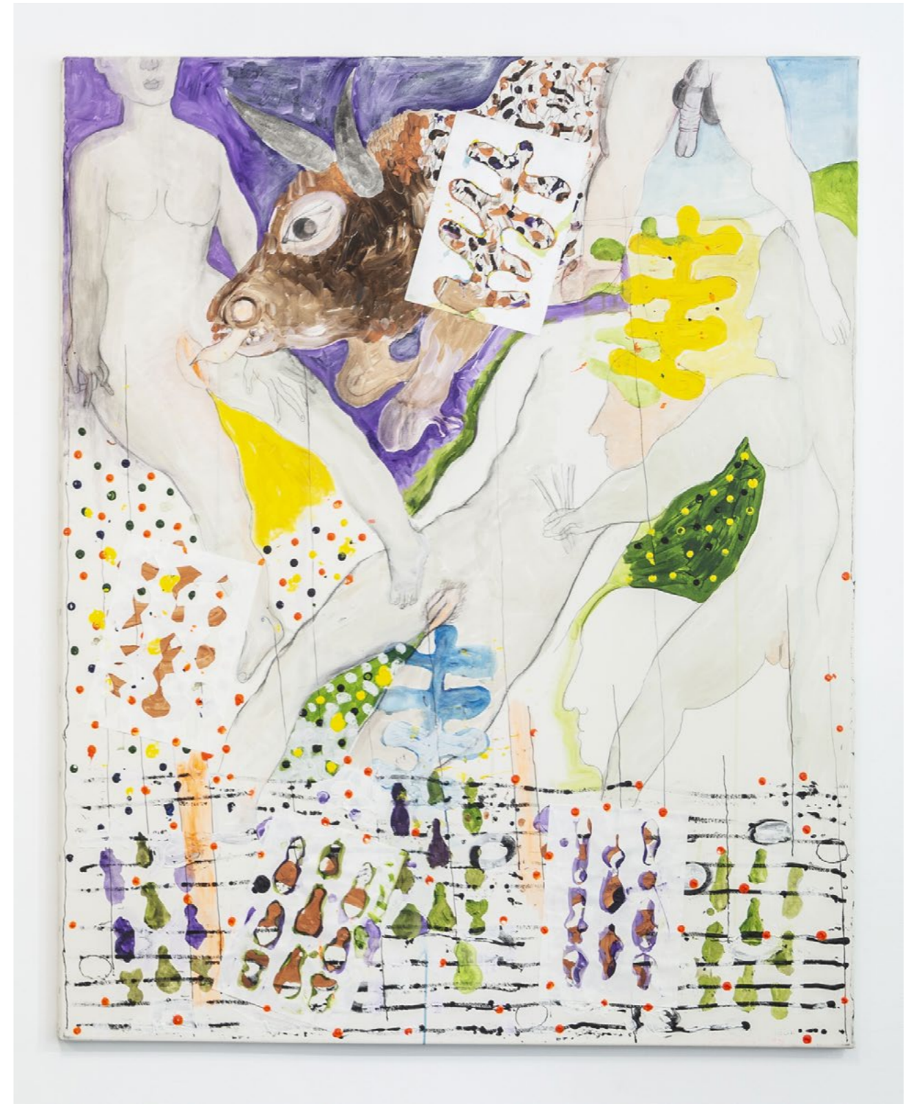
Und doch, 1998 acrylic, pencil, pen paper, collage on canvas 150 x 120 cm

Oberhuber's second exhibition at KOW gathers works from the seven decades of a life in which he witnessed the twists and turns of Europe's postwar evolution. Like Oberhuber's art, Europe is brought to life by its plurality and a sufficient degree of conceptual anarchy and permanent change. Today, as we need to take a stand against the phrases of those who hope to shackle others' ideas, dreams, and actions, we would do well to listen to the voices of those who can share living memories before their past is nothing more than an anecdote in a text.