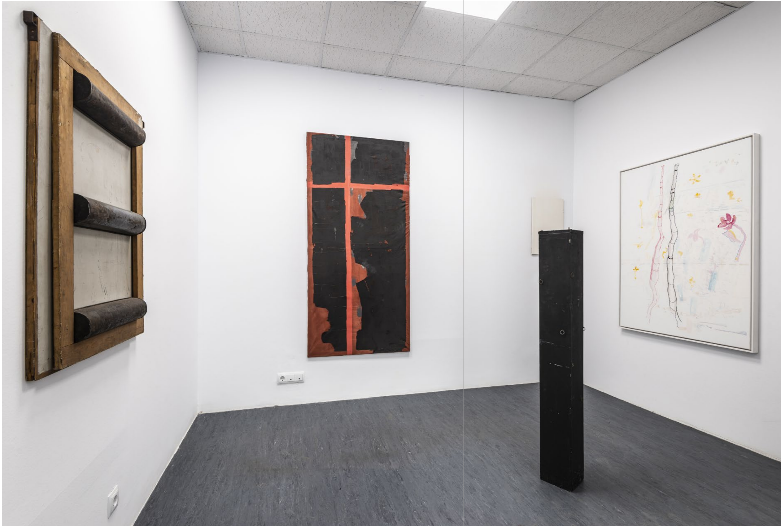
3 Tin Shapes, 1970 mixed media 100.7 x 83.1 x 8.3 cm