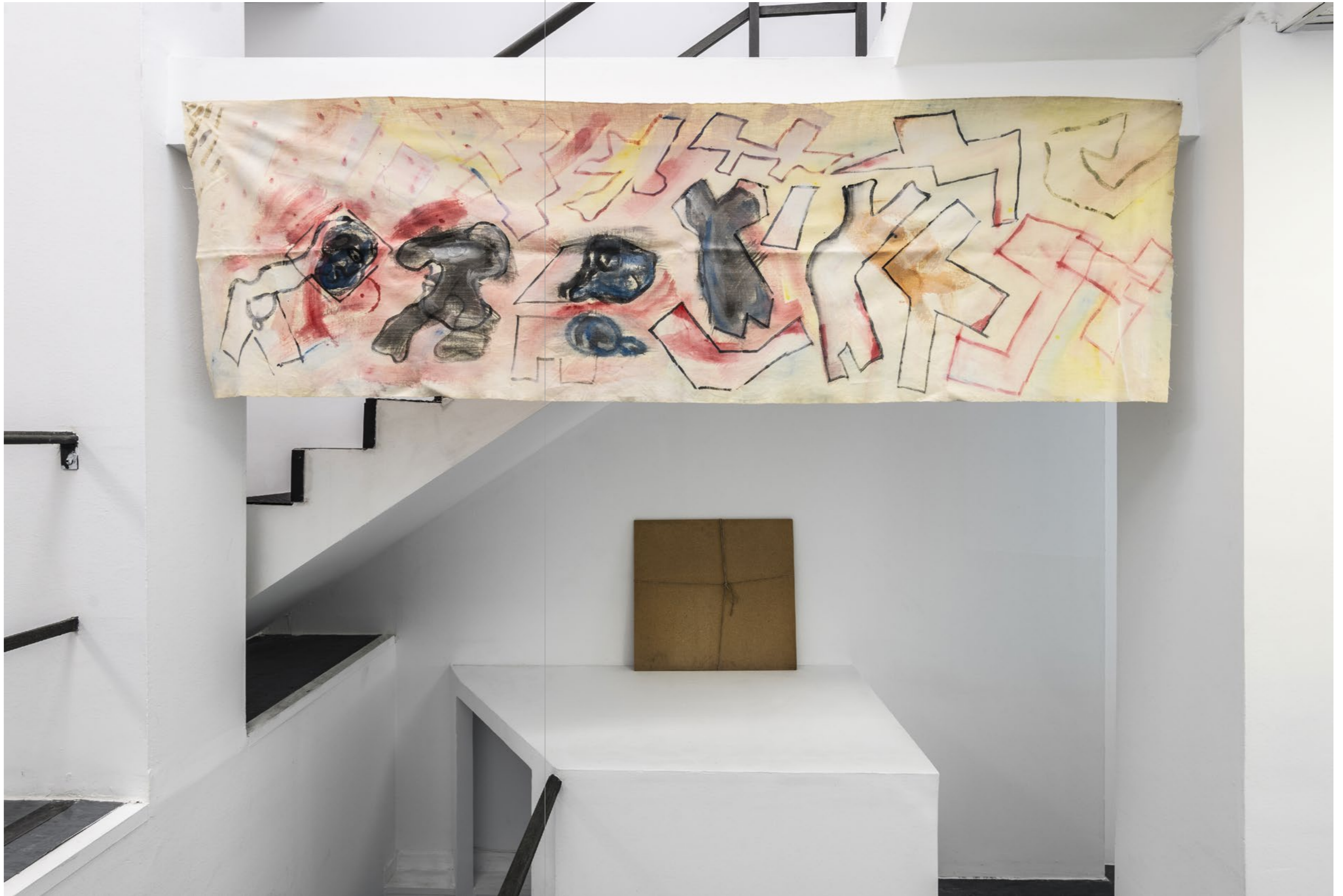
Untitled, n.d. Acrylic on canvas 255 x 75 cm