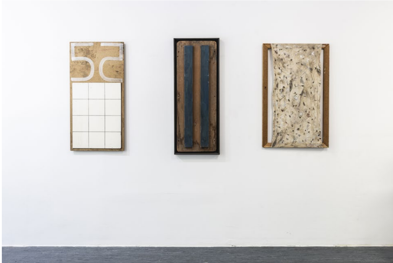
Untitled, 1956 chipboard, fiberboard with embossed tile décor, dispersion 100 x 50 x 1,5 cm